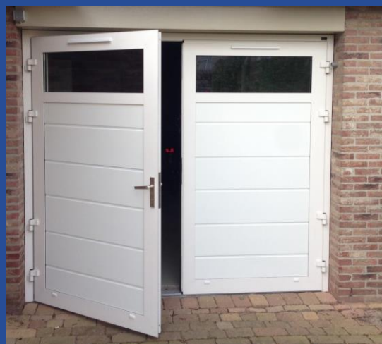
Horizontaal geplaatste glasstrook

Voorzien van dubbel acryl beglazing helder of kristal. Standaardkleur wit, of in gelijke RAL-kleur naar keuze als de deur.