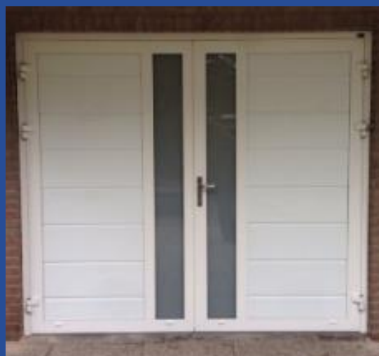
Verticaal geplaatste glasstrook (satiijn)